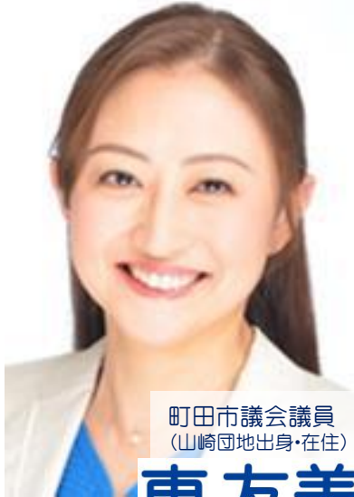
町田市議会議員 (山崎団地出身・在住)

今回の「立憲民主号外」は通常より配布範囲を拡大しております。通常、1～2か月に1度のペースで発行しております。基本的に本人がポストインしております関係で毎回広範囲へのお届けは難しく、新たに手にされた方で毎回のお届けをご希望の方は大変お手数ですがお名前とご住所をお電話かメールにてお知らせいただけますと幸いです。