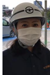
総合防災訓練に参加し、市内避難施設の状況を視察いたしました。

大地震等で避難施設へ避難したが施設は大変な密となっており、そこに感染者がいたため、避難施設全体にコロナウイルスが蔓延してしまった…そのような状況は絶対に回避しなければなりません。私は災害時の間仕切りの設置方法や携帯・簡易トイレの使用方法を親子向けに指導する等、災害対策についても力を入れております。どのような状況でも可能な限り安心安全な避難施設運営ができるよう今後も力を入れて参ります。