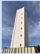
山崎団地センターバス停付近の「町田木曾住宅第2給水塔」は2021年5月下旬にかけて解体され、跡地に「コミュニティ型生活サービス拠点」が建設される予定です。