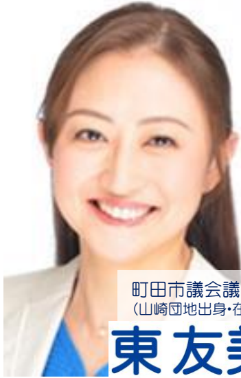
町田市議会議員 (山崎団地出身・在住)